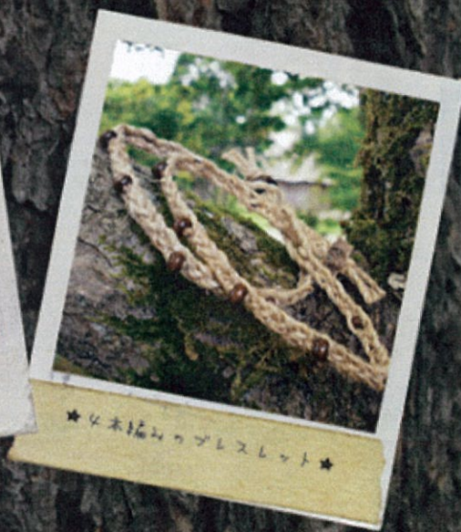
★女木編みアップレスレット★